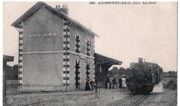
La gare vers 1910