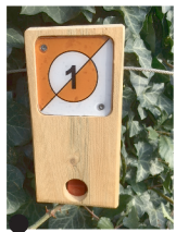
Balise à trouver