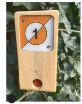
Balise à trouver