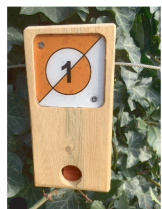
Balise à trouver